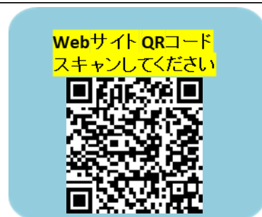
Webサイト QRコード スキャンしてください

※携帯アドレスは、個人の手続き上、メールが見れない場合がございます。(SMSではメールが見れません。Gmailを推奨致します。)