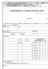
生活保護受給証明書 (緑色)